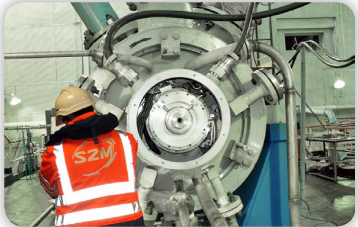
反ドライブエンド側から見た、OEMの工場では組立られているコンプレッサ