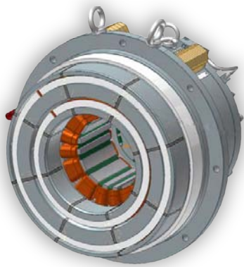
スラスト軸受の片側とラジアル軸受の複合型としています