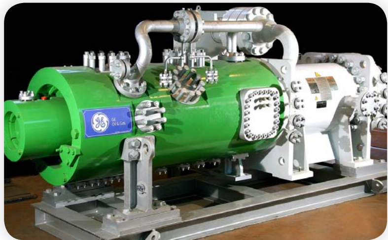
GE Linha de Compressor Integrado com motor de alta velocidade Convertteam (aplicação : instalação de armazenamento de gás)