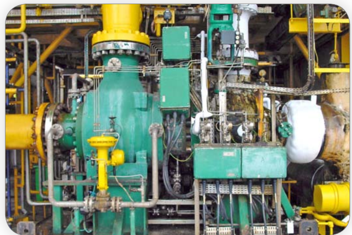
Exemplo de uma máquina GE Rotoflow equipada com rolamentos S2M, funcionando desde 1996 no centro Total N'Kossa (África)